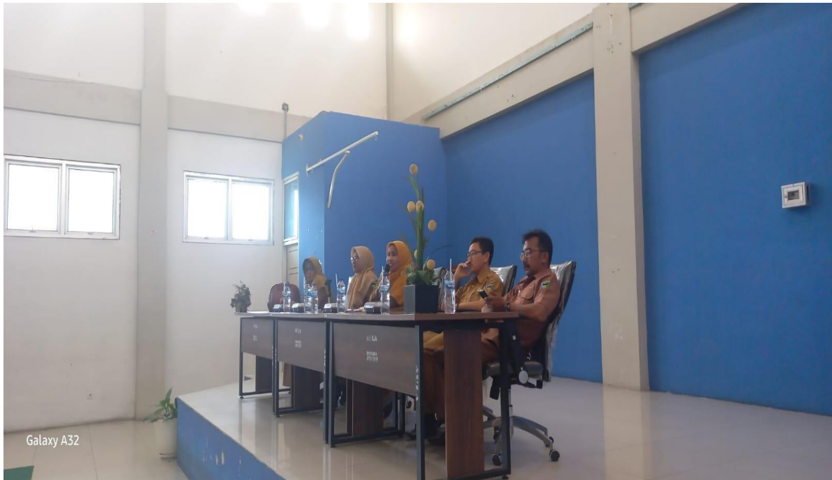
Gambar. Pemaparan Materi oleh Narasumber