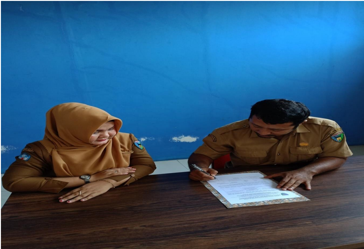
Gambar. Penandatanganan Berita Acara Forum Konsultasi Publik